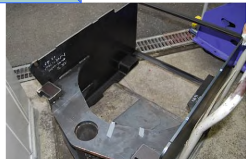
建機フレーム等大型ワークへの刻印