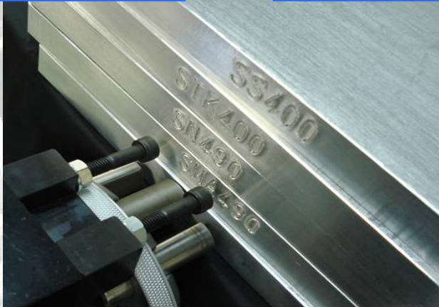
鋼材の材質・識別番号の刻印に