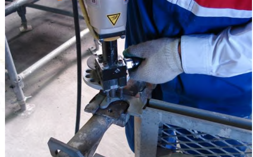
レンタル足場の盗難防止マークの刻印に