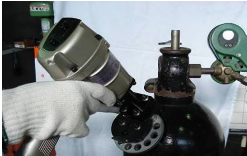
ガスポンベの検査年月日の刻印に